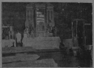
El precioso altar de la ermita