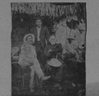
Un grupo de colonos de los más respetables