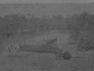
Desembarcadero en el Puerto de la colonia